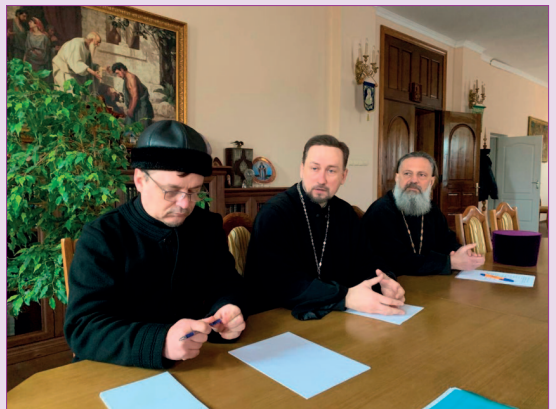
Был заслушан примерный план мероприя-