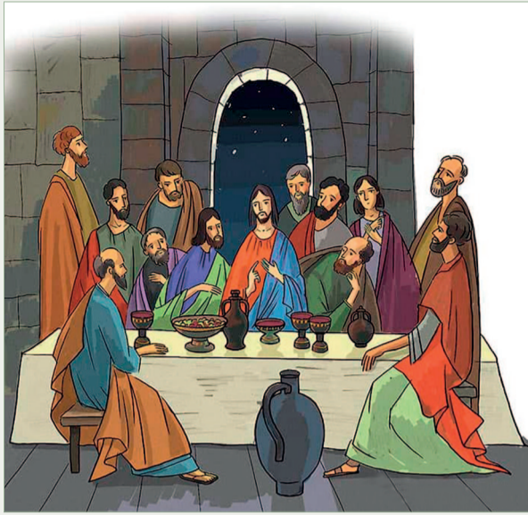
Окончание. Начало на 3 стр.