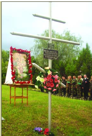
Памятный крест на месте массового захоронения жертв политических репрессий на территории Суворовской крепости

По прибытии верующих к братской могиле началось молебное пение святым Царственным Страстотерпцам, за которым было прочитано евангельское зачало о предсказании Спасителем времен, когда "восстанут дети на родителей, и умертвят их; и будут ненавидимы всеми за имя