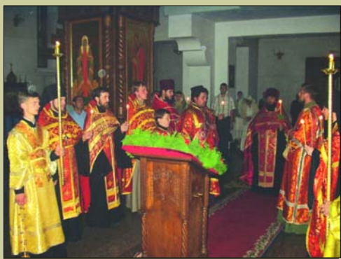
Ночное богослужение в кафедральном соборе

В очередную годовщину убийства царской семьи в ночь с 16 на 17 июля в кафедральном соборе Рождества Христова и Покровской церкви г. Тирасполь, а также в Дмитриево-Солунской церкви с. Суклея были совершены всенощное бдение и Божественная литургия, за которой верующие молитвенно прославляли подвиг Царственных Страстотерпцев.