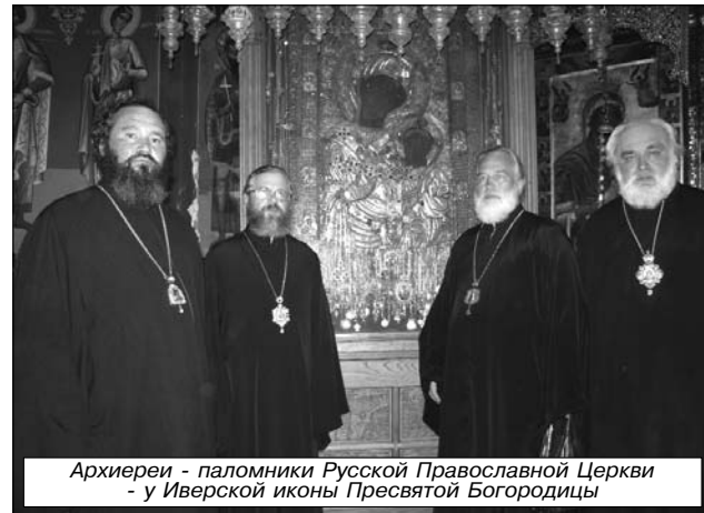
Архиепископы - паломники Русской Православной Церкви - у Иверской иконы Пресвятой Богородицы

Соборный храм освящен в честь Успения Божией Матери. Здесь в отдельном храме при вратах монастырских находится знаменитая чудотворная икона Божией Матери, называемая Иверской.