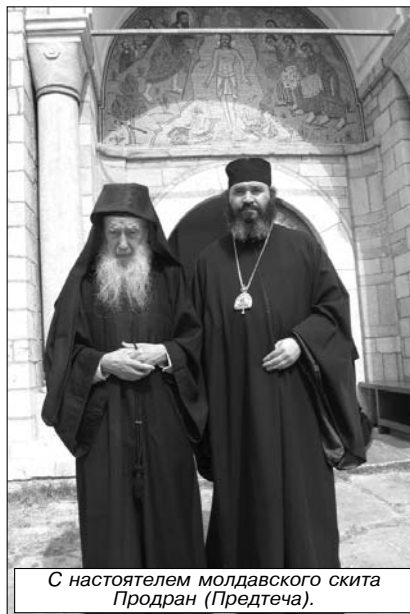
С настоятелем молдавского скита Продран (Предтеча).

При южной стене собора находится гробница святого Симеона, отца святителя Саввы Сербского. Над гробницей вьется виноградная лоза, плодам которой приписывают целительные действия, особенно для неплодных супругов.