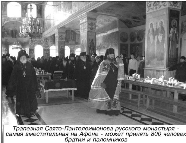
Трапезная Свято-Пантелеимонова русского монастыря - самая вместительная на Афоне - может принять 800 человек братии и паломников

Главный собор монастыря посвящен имени великомученика и целителя Пантелеимона, которого честная глава, здесь находящаяся, составляет утешение и бесценное украшение и сокровище как храма, так и всей обители. Кроме того, в этом храме находятся и другие святыни: части Древа Креста Господня и святых мощей - Пророка Иоанна Предтечи и Крестителя Господня, глава преподобномученики Параскевы. Здесь же есть значительная часть от камня, отваленного от Гроба Господня, из которого сделан семисвещник.