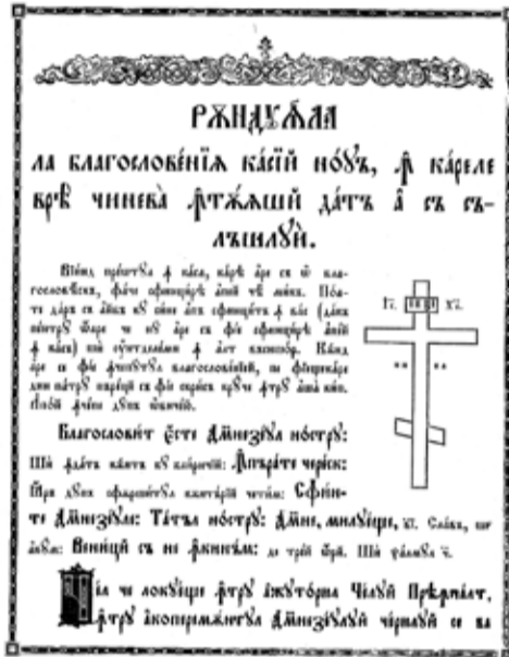
Фрагмент требника на молдавском языке

нославянские, которые в настоящее время являются архаизмами. Таким образом, старославянские или церковнославянские являются неотъемлемой частью молдавского литературного языка. Они уже более шестисот лет живут в языке, поэтому их можно воспринимать не как "пришельцев", а как свои родные слова. Тем более, что значение этих слов связано большей частью с высокой нравственностью и христианской духовностью.