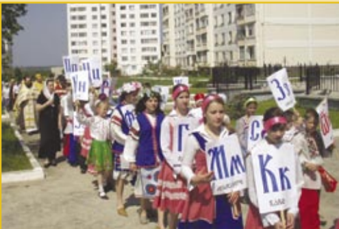
Крестный ход в Кирилло-Мефодиевском храме г. Днестровск в день памяти равноапостольных просветителей славян

Русские присоединились через эту миссию ко всему славянскому миру народов Православного Востока.