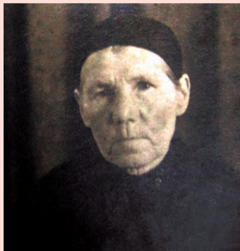
Таранта Е.О. 1949 г.