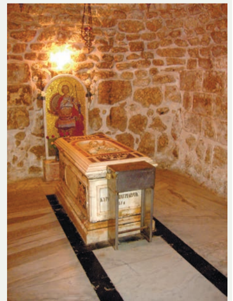
Гробница св. Георгия Победоносца в Лоде

Одним из самых известных по смертных чудес святого Георгия является победа его над змием (драконом), опустошавшим землю одного языческого царя. Когда выпал жребий отдать на растерзание чудовищу царскую дочь, явился великомученик Георгий на коне и пронзил змия копьем, избавив царевну от смерти. Явление