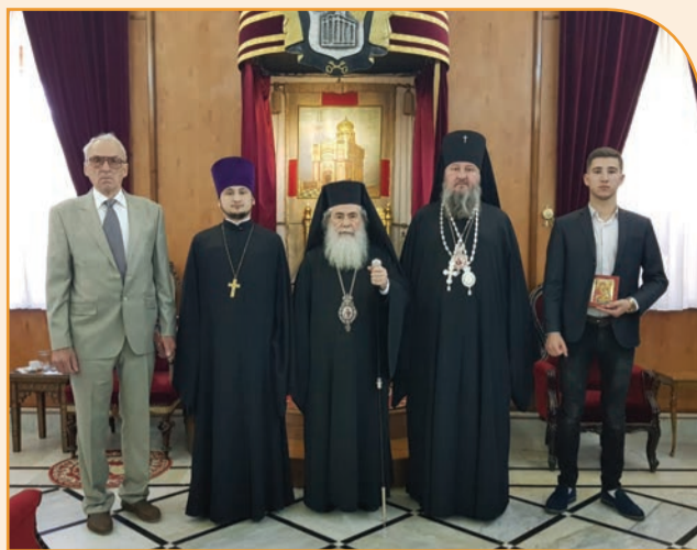
Паломническая группа из Приднестровья с Патриархом Иерусалимским и всея Палестины Феофилом III