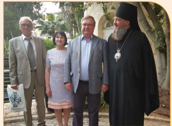
Члены Приднестровского представительства с председателем ИППО С.В. Степашиным

Это Земля, куда издавна стремились верующие люди: и богатые и бедные, и знатные и простые, и старые и юные, и мужи и жены, и святые и грешники. Это Земля, где обрела св. равноапостольная Елена животворящий Крест, куда на поклонение устремлялись всем нам близкий и дорогой Святитель Николай Чудотворец и многое множество верующих людей со всех стран света.