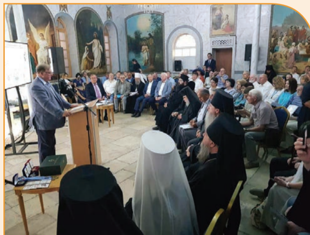
На пленарном заседании Международного семинара ИППО. Выступает председатель ИППО С.В. Степашин

ственная организация объединяет людей по всему миру, независимо от государственной или конфессиональной принадлежности. Это, прежде всего, союз единомышленников.