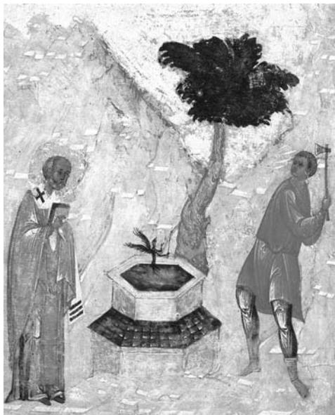
Свт. Николай изгоняет беса Клеймо с древнерусской иконы

По преданию, одна из первых церквей, появившихся на Руси задолго до принятия христианства (предположительно, при княгине