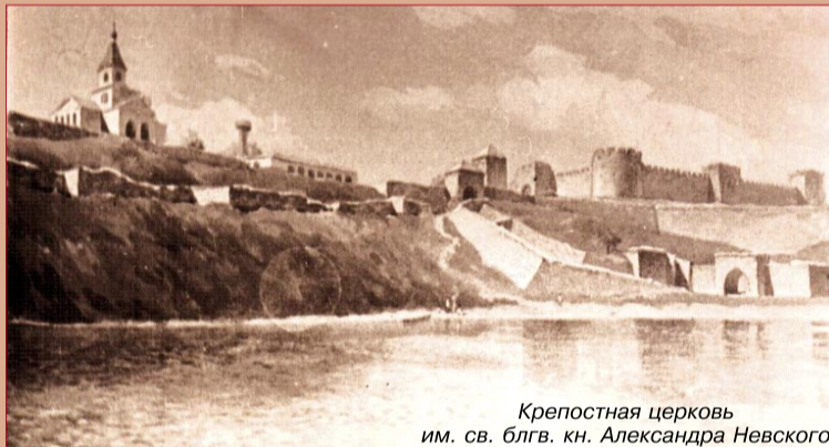
Крепостная церковь им. св. блгв. кн. Александра Невского