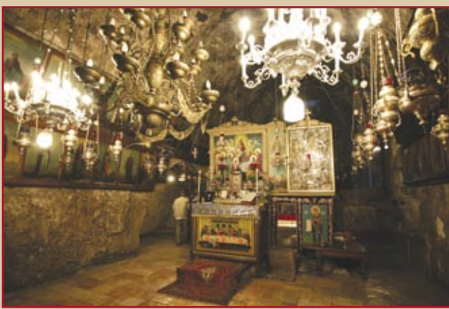
Гробница Богородицы (кувклия), вид с запада

дами, сзади жертвенник. Храм принадлежит грекам и армянам. В каменном кивоте – чудотворная икона Иерусалимской Божией Матери русского письма.