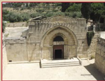
Церковь Успения Богородицы в Гетсимании, фасад XII века

Согласно преданию, здесь апостолами была погребена Богоматерь.